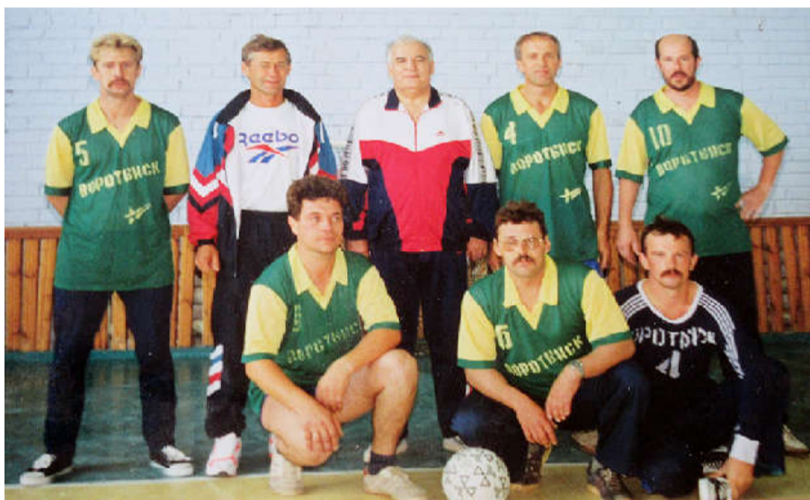
Команда з/управления – чемпион футбольного турнира.

В 1990/1991 учебном году в учреждении занимались 312 чел., в 19 спортивных секциях вели работу 17 тренеров-