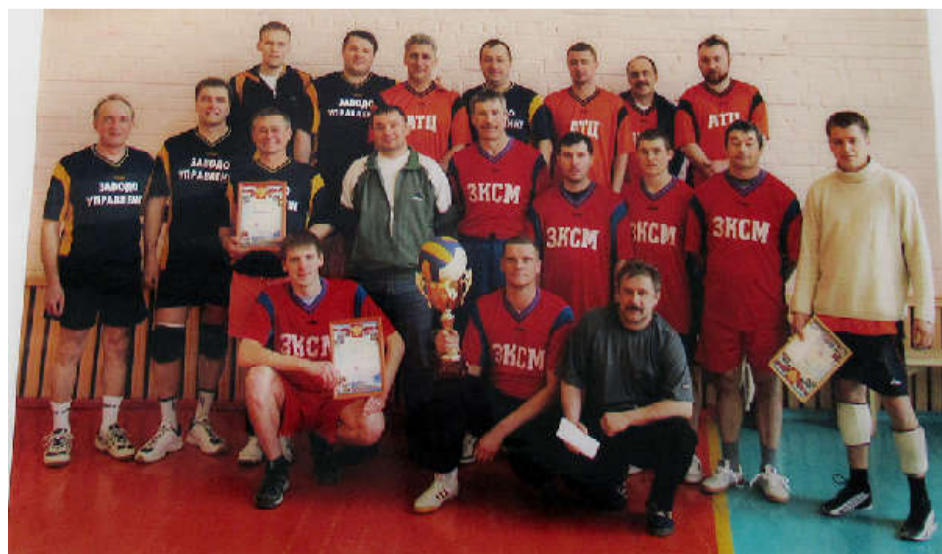
Кубок генерального директора ОАО «Стройполимеркерамика» (2009 г.).

2009 год ДЮСШ: 60 спортивных секций; 1067 человек; 43 тренера, по 23 видам спорта. Спортсекции работали на базах почти всех школ района, ДК «Юность», детского сада «Незабудка», Дома творчества, музыкальной школы и ПЛ-33.